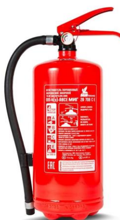
Рисунок 2 - Огнетушитель порошковый Пожтехника ОП-4(з) Миг АВСЕ